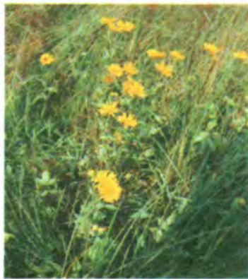
579. Оман британський.